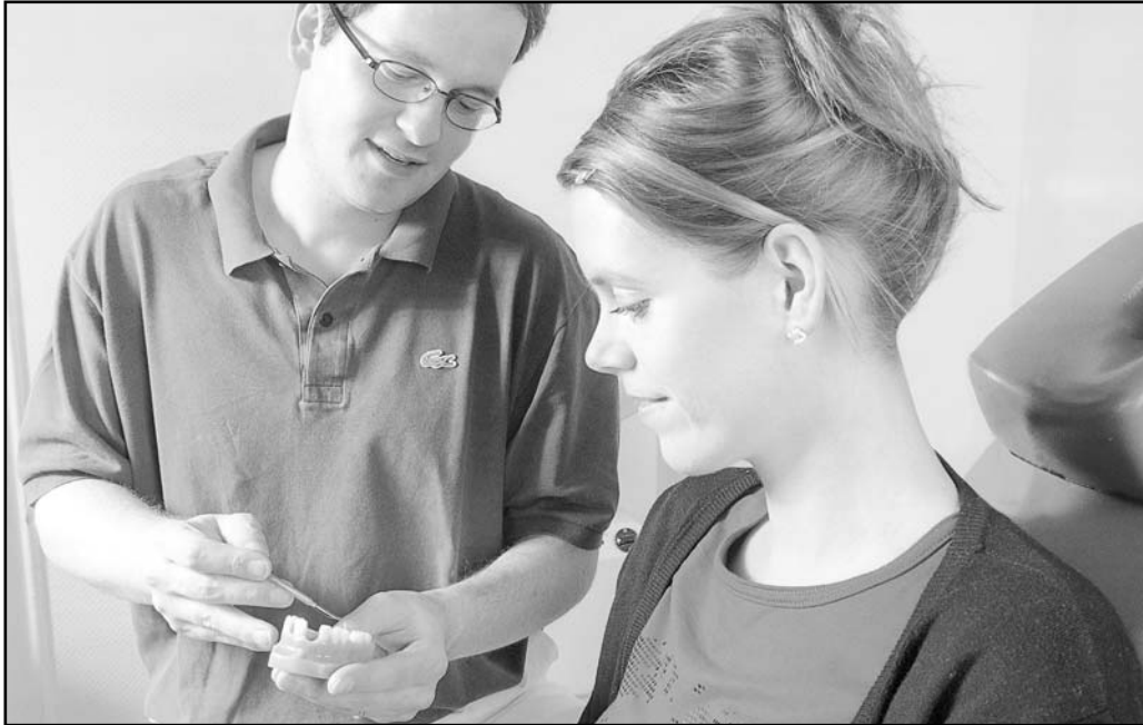
Implantate sind keine Frage des Alters: Junge Menschen lassen damit unsichtbar einzelne Zähne ersetzen. Ältere schätzen sie als komfortable Alternative zu Brücke oder loser Prothese.